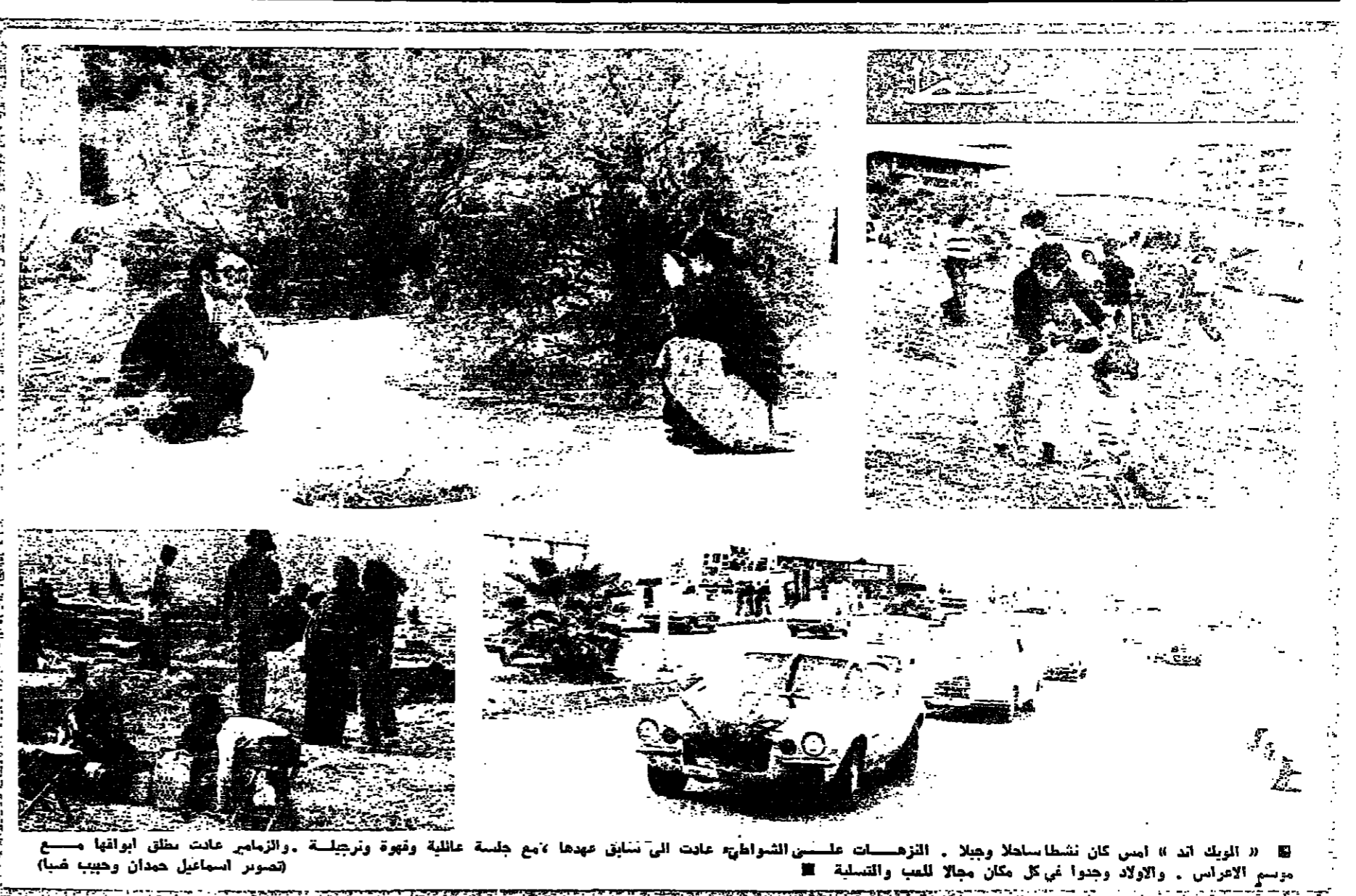
«الملك اند» أمس كان نشطاً ساحلاً وجيلاً . الزهورات على الشواطئ عادت إلى سابق عهدها مع جلسة عائلية وفيرة وتبرجيلة . والزوار عادت مطلق ابواقها مع موسم الأعراس . والأولاد وجدوا في كل مكان مجالاً للعب والتسلية .

ينطلق الدكتور كورت فالداهم من مقر الأمم المتحدة مساء اليوم في مهمات حيوية تهدف إلى جسر الشرق الأوسط وتبصر قريبا من سلام متفاوض عليه . وسيحاول الدكتور العام خلال محادثاته في القاهرة ودمشق وبيروت وتونس ، تحقيق اتفاق على صيغة لاستئناف محادثات سلام في الشرق الأوسط بفضل إجرائها في مؤتمر جنيف . وفي تقريبا سيجتمع الدكتور فالداهم في ١٢ شباط إلى الرئيس القومي مكاريوس والسيد رؤوف نكاشلي الزعيم القومي التركي «البيت في كيف يمكننا على أفضل وجه المسح قريبا نحو تسوية للمشكلة القبرصية» . ويغادر الدكتور فالداهم نيويورك مساء اليوم إلى جنيف حيث أعدت له الأمم المتحدة طائرة خاصة لنقله إلى القاهرة يوم الأربعاء . وكانت الجمعية العامة للأمم المتحدة قد أقرت في الشهر الماضي بالإلحاح كبرى توصية تطالب فيها استئناف مؤتمر جنيف في وقت لا يتعدى ٢٠ آذار ولم يعد مؤتمر جنيف سوى فكرة واحدة عندما اجتمع لفترة قصيرة في كانون الأول عام ١٩٧٣ برعاية الأمم المتحدة وبرئاسة الولايات المتحدة والاتحاد السوفياتي . وإلى الدكتور فالداهم الصحفيين بعد مؤتمر صحفي أعلن فيه قراره بتوجهه في جولة في الشرق الأوسط بأنه يرى ان موعد آخر آذار سابق لأوانه، ولكنه أضاف يقول ان استئناف محادثات جنيف في الربيع احتمالي.